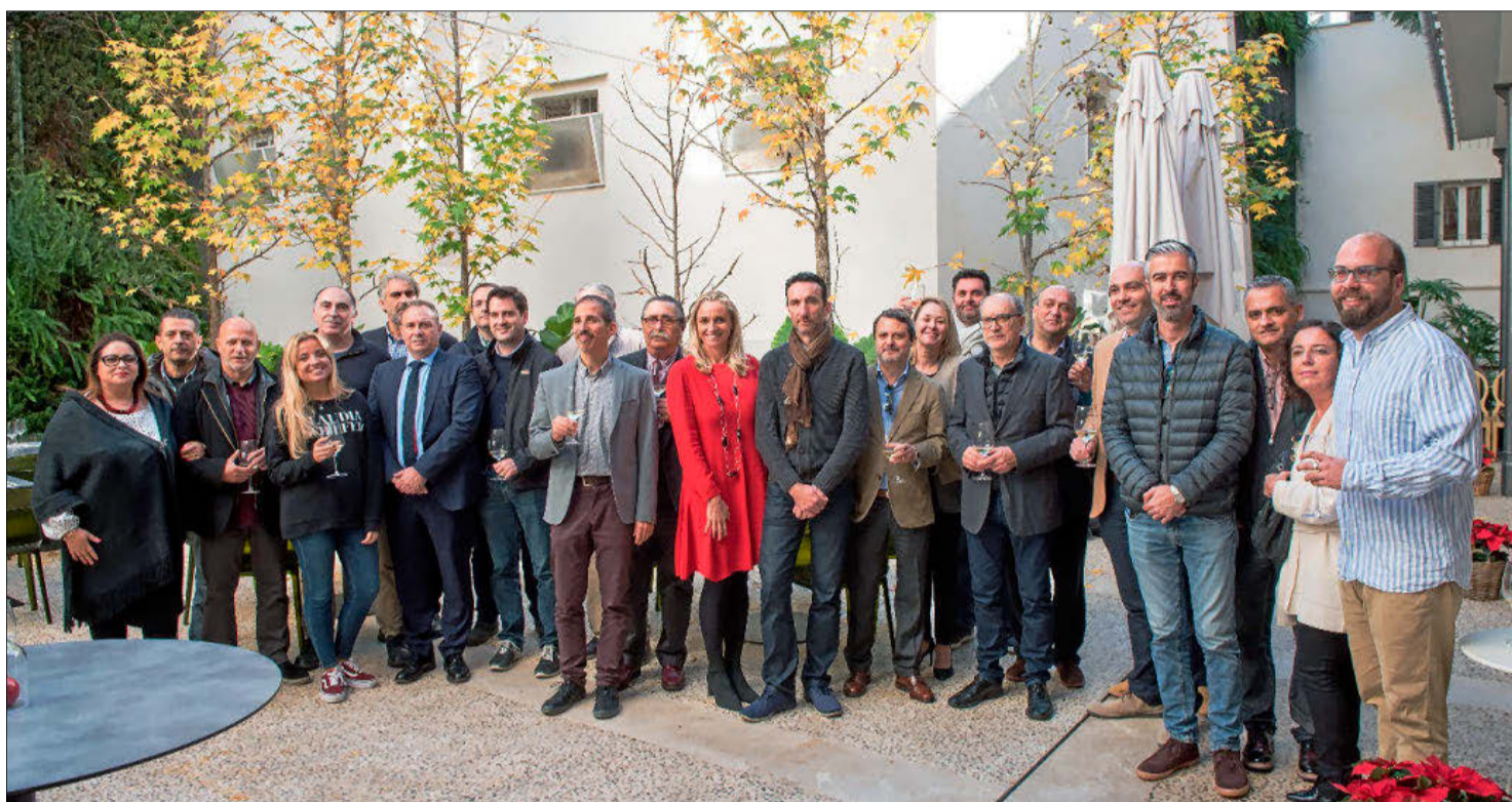
Foto de grupo de los periodistas ayer con los miembros de la directiva de la Federación Hotelera de Mallorca. ALBERTO VERA