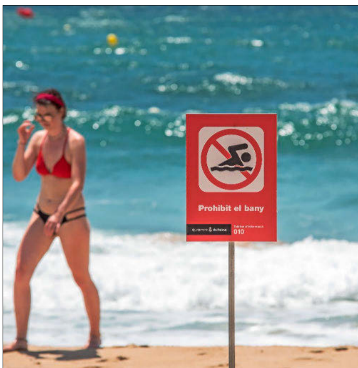
Estado que presentaba la playa de Can Pere Antoni el pasado martes.

Las dos asociaciones profesionales remitirán mañana una carta al alcalde de Palma, José Hila, en la que le avisan de la «muy mala imagen» que provocan los vertidos y lamentan que se produzcan «nuevamente en plena temporada turística». Según los hoteleros, esta situación «genera numerosas quejas