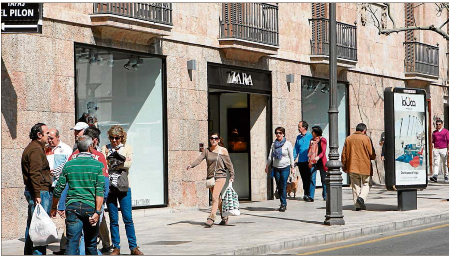
La apertura comercial de los domingos se considera un elemento importante para la desestacionalización. MIQUEL MASSUTÍ